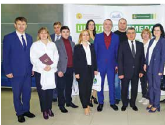
После вручения дипломов «Школы фермера» РСХБ.

вать молодняк, а затем поставят скороспелую баранину высокого качества в магазины и на оптовые базы. Совместными усилиями уже к концу года поголовье овец здесь может увеличиться на четверть. За помощью со-