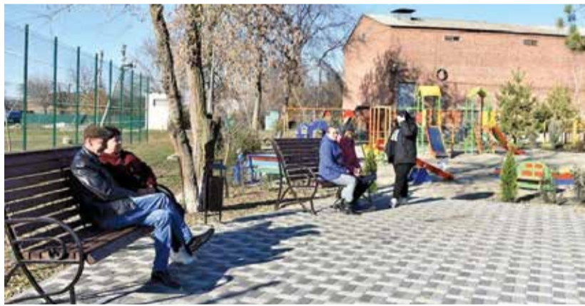
Парк в станице Николаевской.

Ксения Жукова, фото из архива Администрации Константиновского района