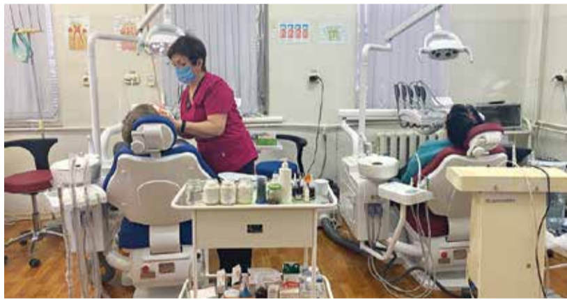
Стоматологическая установка в центральной городской больнице.

отчеты о проделанной работе, новости района, поздравляет земляков с праздниками, приглашает их принимать участие в субботниках, акциях, культурно-развлекательных мероприятиях.